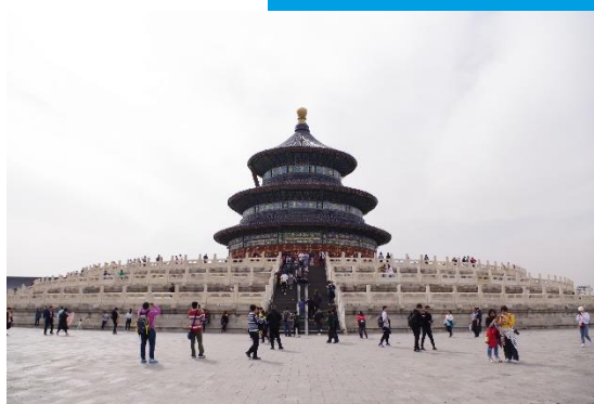
Zdjęcie nr 8. Świątynia Nieba w Pekinie.

Zakazane Miasto otaczają 4 świątynie-ołtarze, na których cesarze składali ofiary: Nieba od południa, Słońca od wschodu, Księżycy od zachodu oraz Ziemi od północy. W Świątyni Nieba, najważniejszej ze świątyń cesarskich znajdują się dwie budowle: Komnata Modlitw za Dobre Zbiory oraz wzniesienie z ołtarzem. Każda z nich wybudowana została na planie koła, po środku kwadratowego placu. Kompleks otacza mur, który od północy ma kształt półokrągły, zaś od południa kwadratowy. Świątynia jest swoistą reprezentantką wiedzy na temat świata, którą posiadali jej budowniczy. Komnata Modlitw za Dobre Plony otoczona jest trzema rzędami kolumn, wewnętrzny składa się z 4 i symbolizuje pory roku, środkowy i zewnętrzny liczą po 12 i symbolizują 12 miesięcy oraz 12 godzin w tradycyjnym chińskim systemie mierzenia czasu. Kolumnada odzwierciedla wyobrażenia dotyczące porządku kosmicznego.