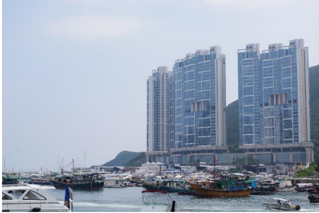
Zdjęcie nr 10. Wieżowce z bramami dla smoków.