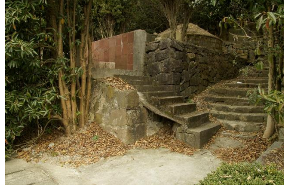
Zdjęcie nr 2. Fragment cmentarza na Wzgórzu Dziewięciu Smoków w Ningbo.