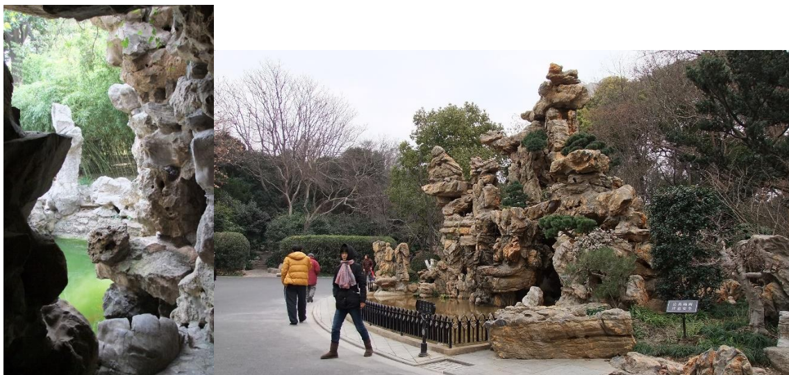
Zdjęcie nr 4. Kompozycja ze skały i wody wewnątrz domostwa Ge Yuan w Yangzhou. Fot. Magdalena Gimbut. Zdjęcie nr 5. Kompozycja ze skały i wody w parku LuXin w Szanghaju. Fot. Magdalena Gimbut.