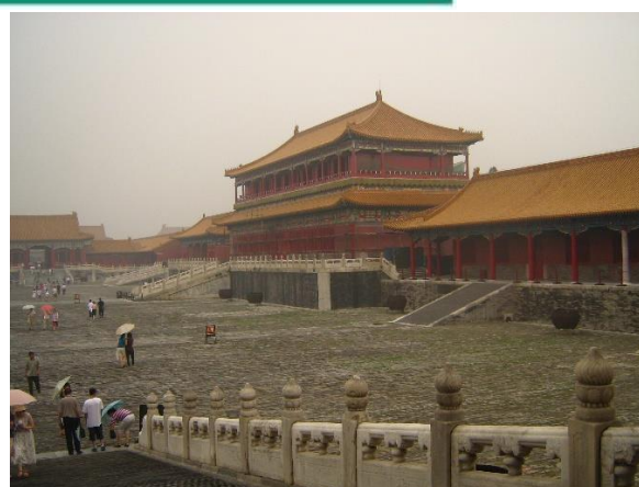
Zdjęcie nr 6. Wejście do Zakazanego Miasta.