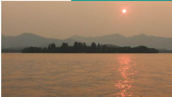
Zdjęcie nr 3. Krajobraz Hangzhou.

Krajobraz stworzony zgodnie z zasadami feng shui musi zawierać 2 podstawowe elementy: wodę i wzgórze. Wzgórze oznacza stabilność, powiązane jest symbolicznie z mocą oraz ochroną. Woda, czy to w postaci rzeki, kanału, jeziora, stawu czy morza jest elementem dynamicznym, oznacza zmianę, powiązana jest „symbolicznie z finansami. Okolica zasobna we wzgórze i wodę uchodzi za doskonałą, wzorcową. Tak stało się na przykład z chińskim miastem Hangzhou, którego Jezioro Zachodnie znajduje się w dolince między górami, i które przez wielu uznawane jest za jedno z najpiękniejszych krajobrazowo miejsc w Chinach. Zgodnie z zasadami geomancji kraj, który nie ma żadnej znaczącej góry oraz dostępu do znaczącego zbiornika wodnego nigdy nie doświadczy pełnego rozwoju. Woda i góra stają się także metaforami doskonałego charakteru. Człowiek, jak woda, powinien być na tyle elastyczny, by móc się dostosować do wszystkich warunków, lecz równocześnie na tyle stabilny, jak góra, by zachować swą istotę, tożsamość.