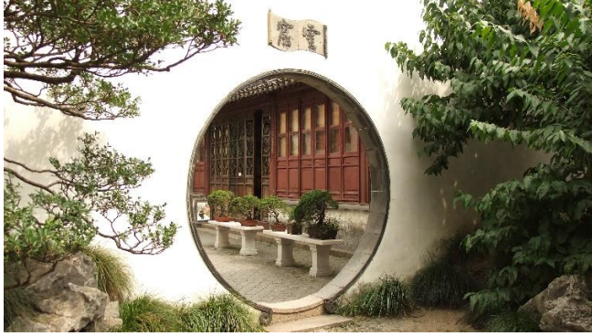
Zdjęcie nr 1. Brama księżycowa w ogrodzie Master of Net w Suzhou.